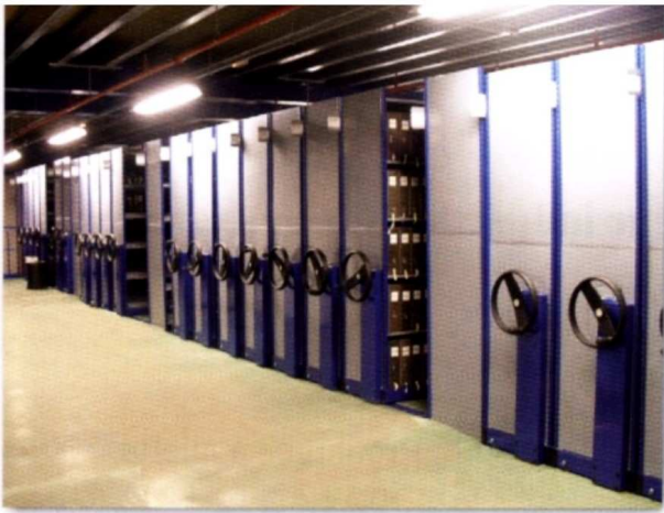
Application avec un rayonnage tubulaire.