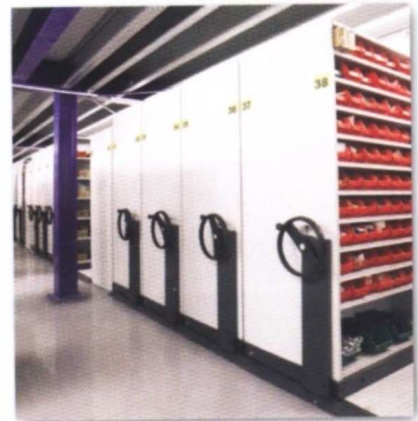
Application avec un rayonnage tôle modulable.