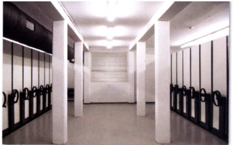
Mécanisme d'entraînement par friction ou à crémaillère.