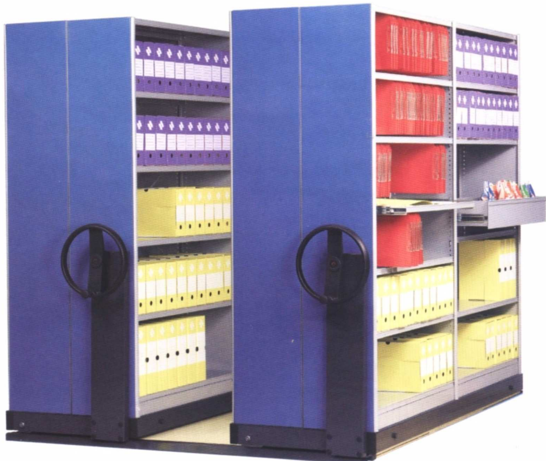
Application avec un rayonnage tôle à parois.